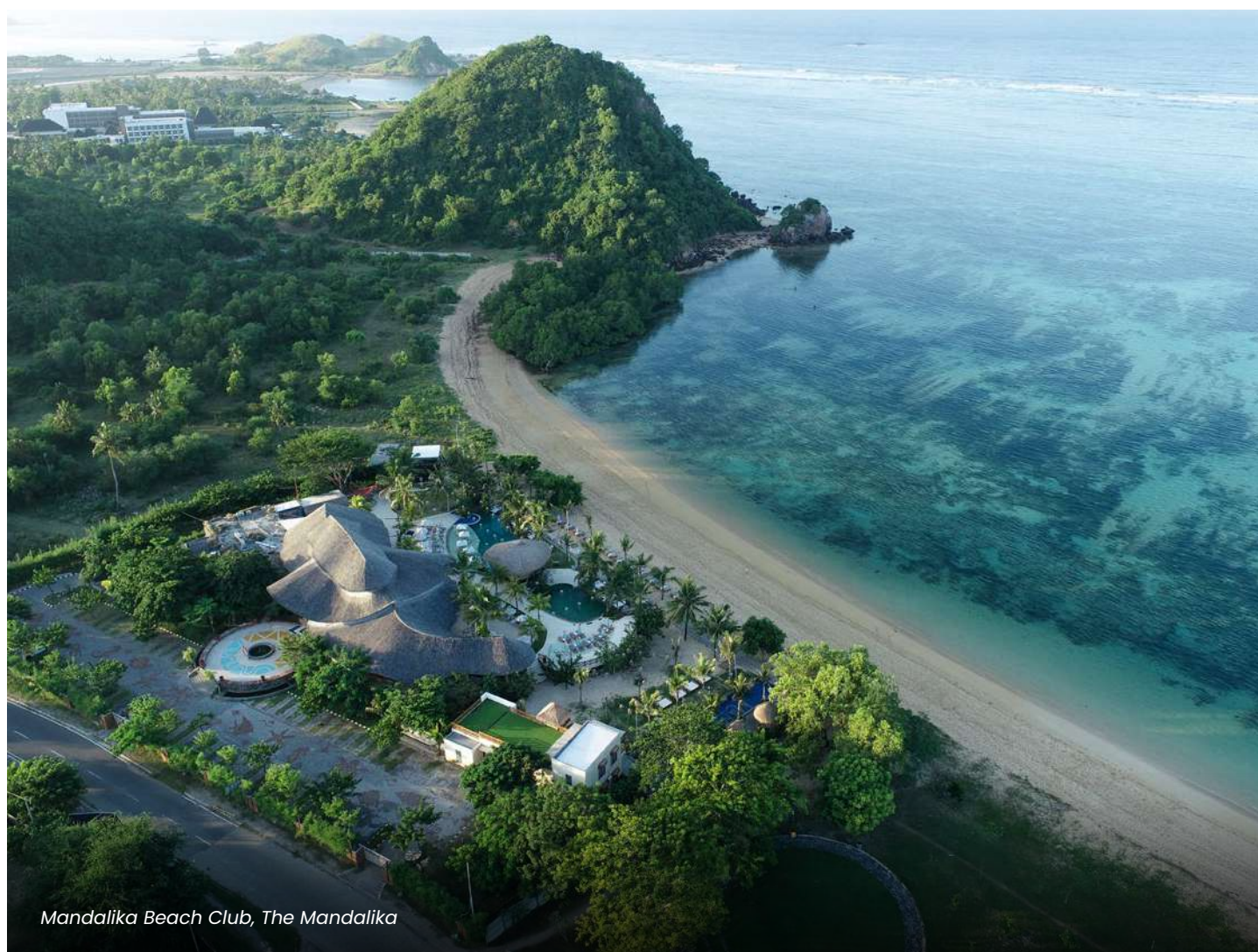
Mandalika Beach Club, The Mandalika

Kehadiran legenda MotoGP, Valentino Rossi, di Mandalika International Circuit menegaskan The Mandalika sebagai panggung sport tourism berstandar kelas dunia. Sepanjang 2025, ITDC (InJourney Tourism Development Corporation) juga membukukan kinerja positif melalui okupansi stabil dan pertumbuhan kunjungan signifikan di The Nusa Dua, The Mandalika, dan The Golo Mori. Pengakuan melalui dua penghargaan Tri Hita Karana Tourism Awards 2026, termasuk Lifetime Achievement , semakin memperkuat komitmen ITDC menghadirkan pengelolaan destinasi yang berkelanjutan dan berdampak bagi masyarakat.