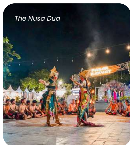
The Nusa Dua

Di The Nusa Dua, acara Balada Budaya Akhir Tahun di Bali Collection menghadirkan perpaduan hiburan modern dan seni tradisional, mulai dari tarian Legong, Kecak, dan Jegog hingga Fire Dance serta penampilan live music yang memeriahkan suasana. Sementara itu, The Mandalika menyelenggarakan New Year's Gala Dinner bertema "Unmasking Radiance" di Pullman Lombok Merujani Mandalika yang semakin semarak dengan penampilan spesial dari Geisha. Adapun The Golo Mori merayakan malam pergantian tahun melalui acara Bajo Bohemian Rhapsody di NUKA Beach Club, menghadirkan atmosfer bohemian yang hangat dan eksklusif bagi para pengunjung.